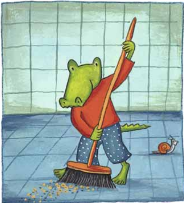
Cocodrilo es pequeño, pero tiene un gran corazón.