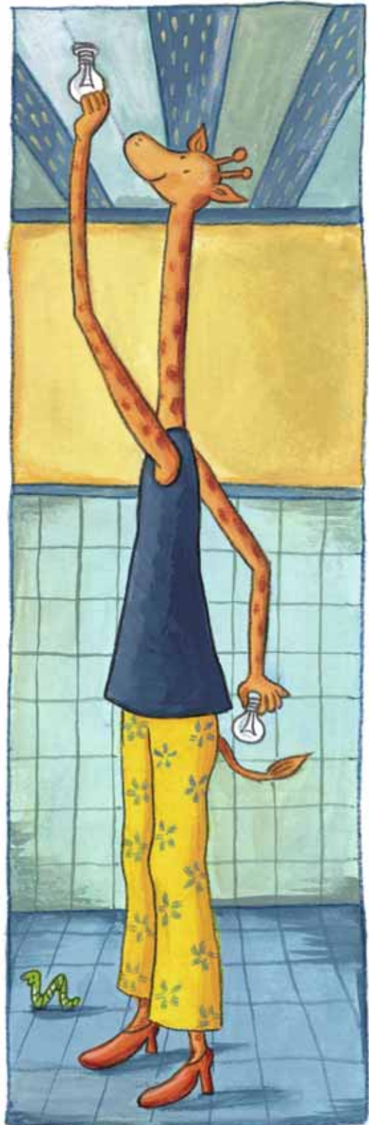
Ella, Jirafa, es el amor de su vida.